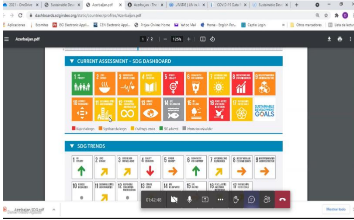
MSS missiyası zamanı istifadə olunan Azərbaycanın DİM xəritəsi

Bunun arxasında duran əsas ideya Azərbaycanın milli proqramı ilə yanaşı AZSTAND-nın MSS layihəsində DİM-dən bəzilərinin əks etdirilməsi imkanlarının müzakirə edilməsi və düşünülməsi idi.